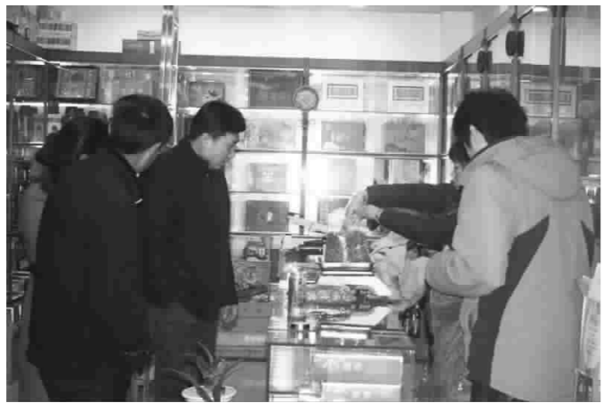
总投资6亿元的江苏白马商城自开业以来,采取多种措施,扩大影响,集聚人气,正逐渐成为城北乃至大市区居民的重要购物场所。图为顾客在周氏茶行争相选购茶叶的场景。

昨天,笔者从区财政局了解到,今年我区获省财政奖补资金569万元,财政奖补项目实施惠及全区9个镇及环保产业园的57个村,实施项目136个,项目总投资概算1388.38万元,其中投入一事一议筹资筹劳建设资金577.35万元,奖补财政资金569万元,其他建设资金242.03万元。 今年我区被省确定为开展村级公益事业建设一事一议财政奖补工作的试点地区。为了更好地发挥财政资金和社会各界参与村内公益事业建设的积极性,我区开展了宣传发动、方案编制、项目实施等工作,这些项目的实施极大地改善了项目实施村公益事业落后的状况,为群众解决了实实在在的困难。 (潘晓东 蔡金柱 马树国) 随着江苏沿海开发正式上升为国家战略和大市区“东向出海”战略部署的加快实施,以及区行政中心的正式启用,亭湖新区肩负着造城和建区的双重任务。该区在加快基础设施建设的同时,积极招引房产、餐饮等服务业项目,逐步完善东区的城市功能。按四星级标准配备设计和装修的精品商务型酒店——东港国际大酒店已投入运营,总投资8亿元的加州东郡南侧房地产项目已摘牌正在办理开工前的手续;年初招引的、投资5000万元的6+1快捷连锁店已正式营业。 (宣江 周强)