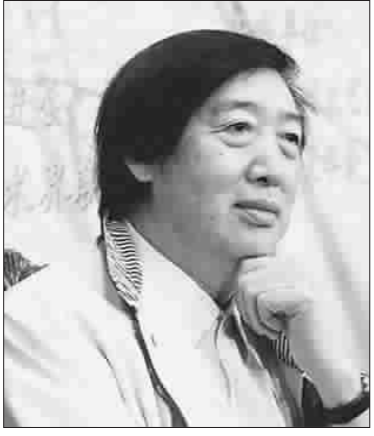
著名当代作家冯骥才

陈志平 孙成栋 华都市的窗口,也为中国文学史上增添了一群别开特色的“俗世奇人”。小说《好嘴杨巴》是冯骥才“俗世奇人”18篇市井人物小说中最有特色的一篇,以主人公杨巴为代表的这一类善手艺人,处于社会最底层,地位低下,在谋生过程中经常受到来自各方面的轻视、排斥、剥削和挤压。