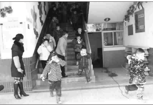
12月7日下午,一场旨在提高幼儿火灾逃生的消防演练在解放路实验学校第一附属幼儿园举行。全国幼儿在老师的组织带领下,有序地按照预定的消防演练方案撤离现场。通过演练,提高了幼儿园师生的消防意识和逃生技能,真正把消防安全工作落到了实处。图为该园演练场景。

正在丹麦首都哥本哈根召开的联合国气候大会让人们开始关注低碳经济。低碳经济就是以低能耗低污染为基础的经济,通俗地讲就是降低二氧化碳排放量,倡导人们在生活中、生产中,尽量减少“碳”排放。 不要以为减“碳”行动完全是政府的事情,“低碳”是一个时髦词汇,但并不遥远,与我们的生活息息相关。日常生活中吃、住、行等每一个细节都在制造“碳排放”,每吃一顿饭、开关一次电器以及每次出行都会直接或间接地产生不同程度的二氧化碳排放,而大量的二氧化碳排放则是导致地球变暖的主要因素。 作为一名普通的地球气候公民,我们应该从自身出发,从现在开始,从身边小事做起,开展减“碳”行动,譬如,上下楼尽量不乘坐电梯,将洗手洗脸的水收集起来拖地冲厕所,把家中的灯全部换成节能灯,去超市购物时用自己准备的布袋,尽量购买小排量车型,适度点餐不浪费等等。只要我们人人努力,注重生活中触手可及的小事,就可以大大减少“碳排放”,为延缓地球变暖贡献一份力量。 议论风生