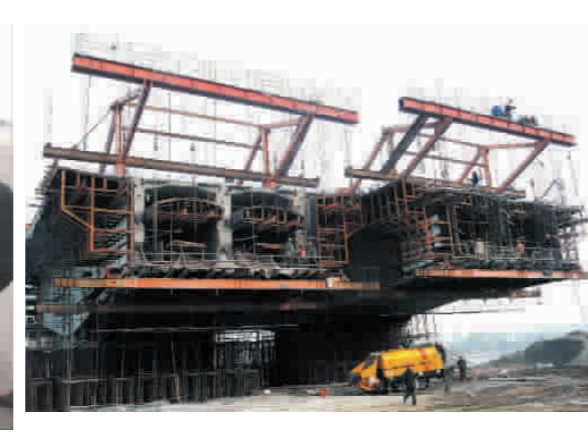
施工人员在大桥紧张施工