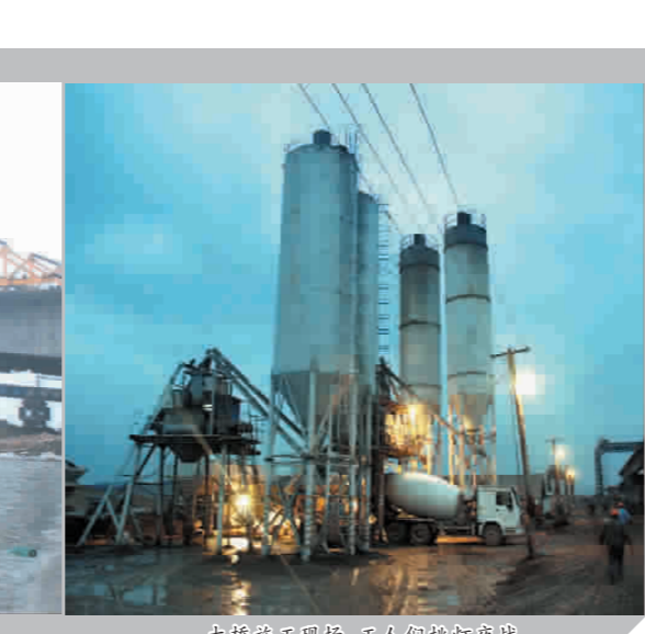
大桥施工现场，工人们抓紧夜战