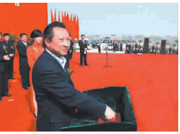
市委书记、市人大常委会主任赵鹏启动大桥开钻电视

331 省道工程是事关沿海开发的交通重点工程。作为该工程的重要节点——通榆河大桥，目前正在紧张建设，明年 5 月建成后将成为亭湖新区连接通榆河西的又一条快速通道，使亭湖新区与老城区和城南新区融为一体。届时，从亭湖新区到达老城区只需 5 分钟。通榆河大桥的建设，开工以来备受广大市民关注。为让读者及时了解最新动态，日前，本报记者深入到大桥建设现场进行了采访。