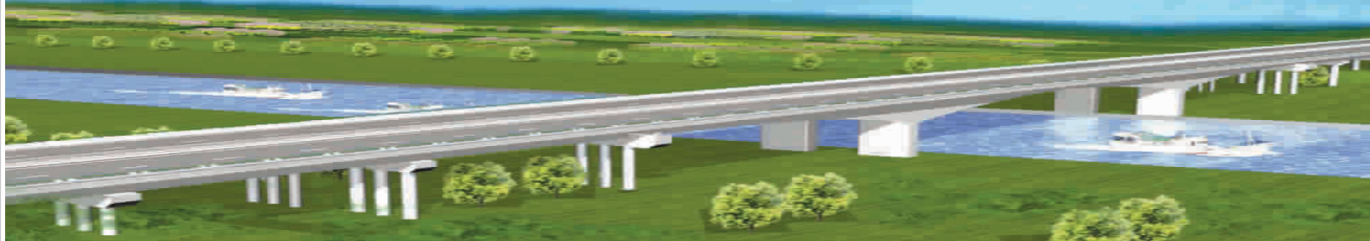
通榆河大桥效果图

331 省道工程是事关沿海开发的交通重点工程。作为该工程的重要节点——通榆河大桥，目前正在紧张建设，明年 5 月建成后将成为亭湖新区连接通榆河西的又一条快速通道，使亭湖新区与老城区和城南新区融为一体。届时，从亭湖新区到达老城区只需 5 分钟。通榆河大桥的建设，开工以来备受广大市民关注。为让读者及时了解最新动态，日前，本报记者深入到大桥建设现场进行了采访。