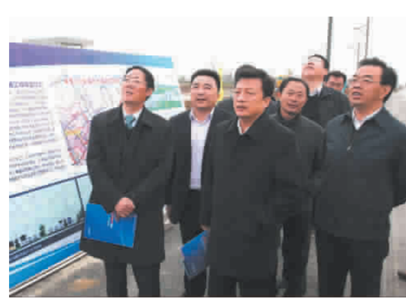
市委副书记、市长李强视察大桥建设